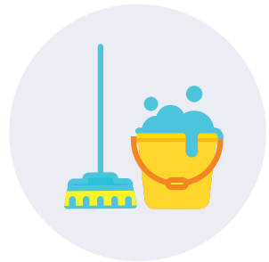
პირადი და საყოფაცხოვრებო ჰიგიენის უზრუნველსაყოფად